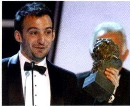
El chileno-español Alejandro Amenábar, premiado.

La esperada fiesta del cine español este año tuvo alfombra verde en vez de roja, pero el glamour no dejó de estar presente. La gala de los Premios Goya 2010, realizada en el Palacio de Congresos de Madrid, contó con la presencia de las máximas figuras del celuloide ibérico.